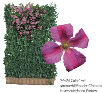
Abbildung 2 Variante für eine Hecke am laufenden Meter