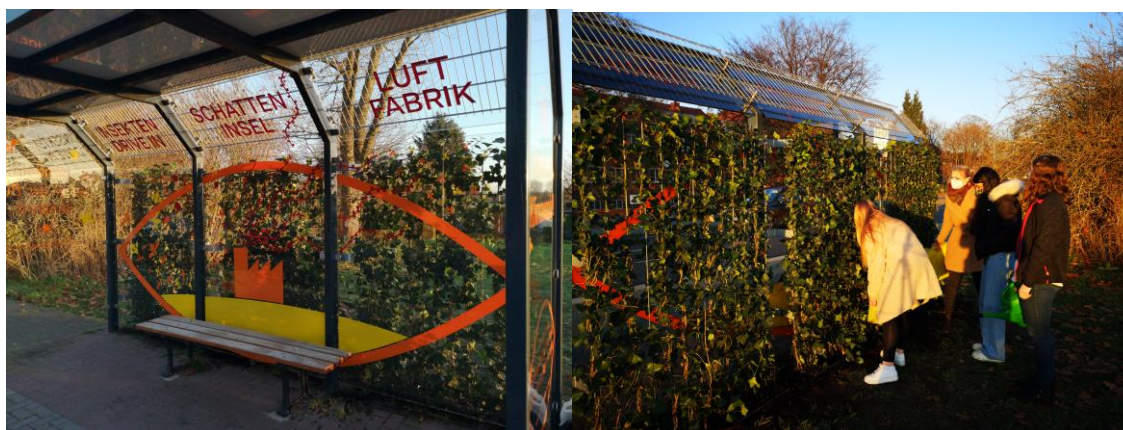
Abbildung 1 Die Schatteninsel im Stadtteil Bahnhof „Weg der Jugend“

Die Begrünung der Bushaltestelle im Bereich Bahnhof ist ein Pilotprojekt und einfaches Beispiel für viele andere Bushaltestellen. Die Gewinner*innen des ersten Preises aus dem Wettbewerb „Jugend dreht am Klimawandel“ setzen hier ihr Preisgeld ein und schafften so eine sichtbare Veränderung in der Stadt. Unterstützt wurden Sie dabei vom Bauhof und Fachbereich 3 der Stadt Boizenburg, PLATZ-B und finanzielle durch die Spende der Bürgerstiftung Region Boizenburg. Mehr Informationen zu dem Mehrwert einer begrüneten Bushaltestelle finden sich hier: www.platzb.de/schatteninsel